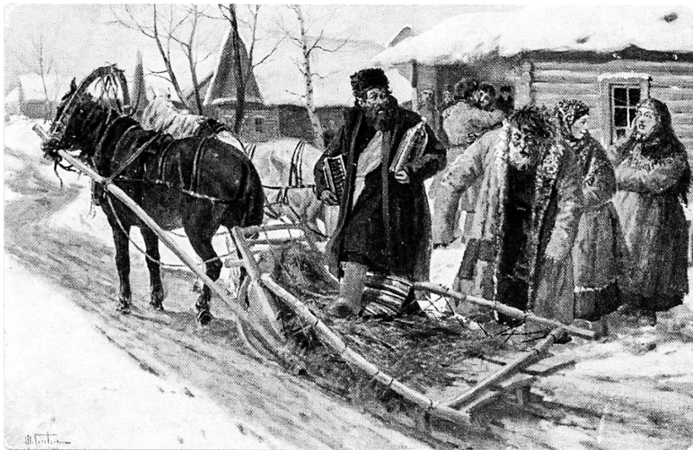
И.М. Львов. На запой. Художественная серия Акционерного Общества Гранберг. Почтовая карточка. Начало XX в.

недостатками и пороками можно назвать: пьянство, сквернословие, распутство, в обоюдных, особенно деловых сношениях, – отсутствие расположения и сострадательности, как бы черствость и даже жестокость сердца, погоня за барышом, выгодой и наживой, а отсюда хитрость, лукавство, руководство правилом: «Каждый сам о себе должен заботиться», ложь, обман, недобросовестность, грубость и непочтительность младших к старшим, ссоры и распри в семье и обществе, отсутствие мира... Относительно пьянства нужно сказать, что оно значительно более распространено среди переселенцев, чем сибиряков, потому что у первых, по заведенному обычаю, ни одна, даже самая незначительная общественная сделка, не обходится без винопития. Особенно безобразное пьянство бывает во время свадеб; здесь пьянствуют не только взрослые мужчины, но и женщины, девицы и даже дети. Такой пьяный разгул редко кончается мирно, а по большей части дракой и другими злокачественными явлениями. Любят упиваться переселенцы, по преимуществу из малороссов, и на поминках, совершаемых об умерших своих родственниках. Поминки обыкновенно совершаются на кладбище, причем приглашенным на поминки предлагается обильное угощение,