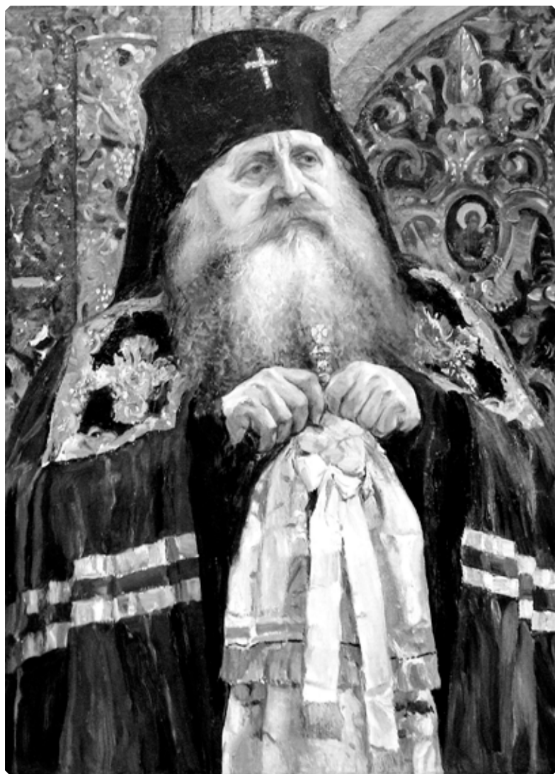
Михаил Нестеров. Архиепископ Антоний Вольнский (Храповицкий) в 1917 году. Х., м. 1917 г. ГТГ, Москва. Фрагмент.

При подготовке рубрики использованы материалы издания: Игумен Дамаскин (Орловский). «Жития новомучеников и исповедников Церкви Русской. Июль. Ч. 2». Тверь. 2016. С. 87–140