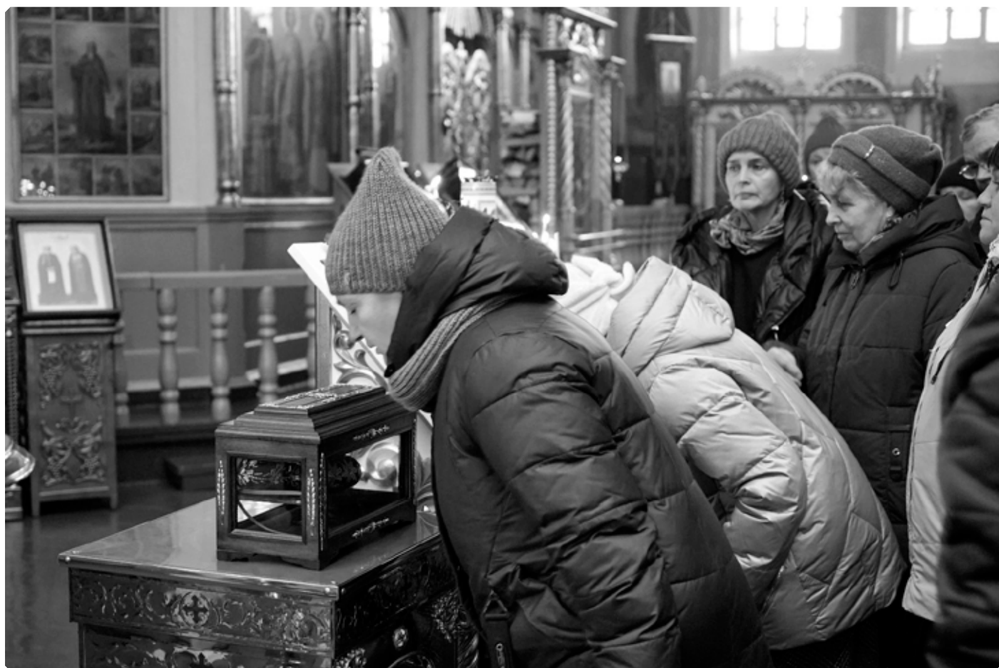
«Святителю отче Спиридоне, моли Бога о нас!» Бийский Успенский кафедральный собор. 24 декабря 2023 г.