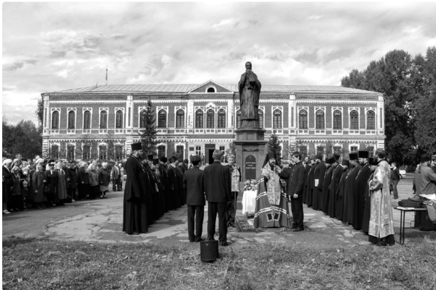
Молебен у памятника святителю Макарию Алтайскому в день празднования 180-летия Алтайской духовной миссии. Бийское архиерейское подворье. 18 сентября 2010 г.