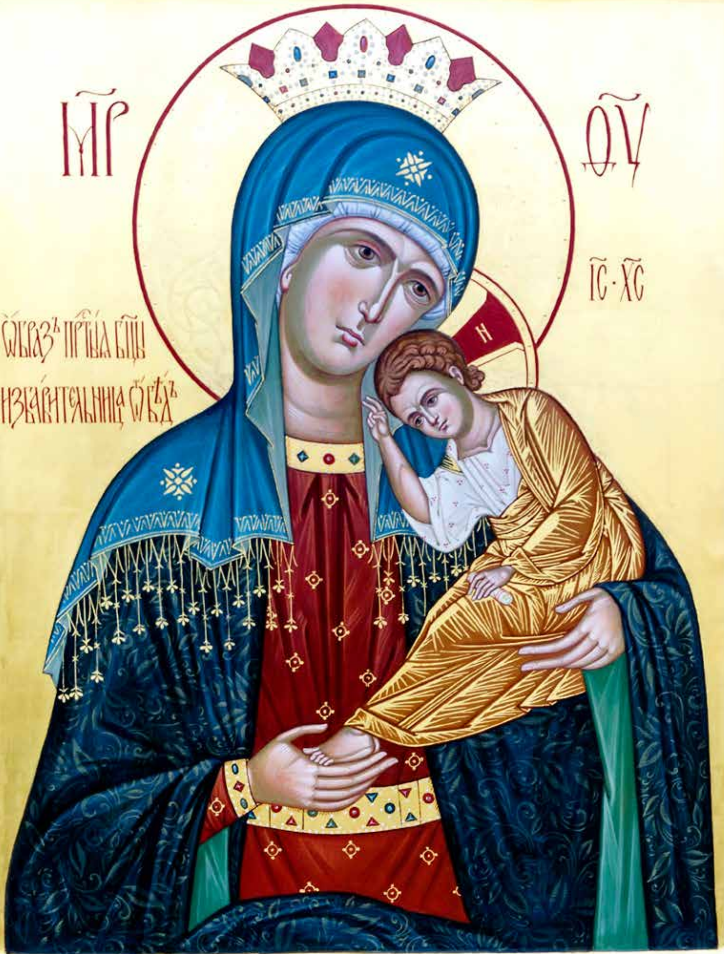
Святыя Мэрыя і Хрысціце дзіцяці. Ікона ў сціхавым перакрыжжы. Дзеянне, выканана ў 1911 годзе ў мастацкай майстэрні І. І. Мухомова ў Івано-Франківску. Сцяжымае: 1911 год. Івано-Франківск.