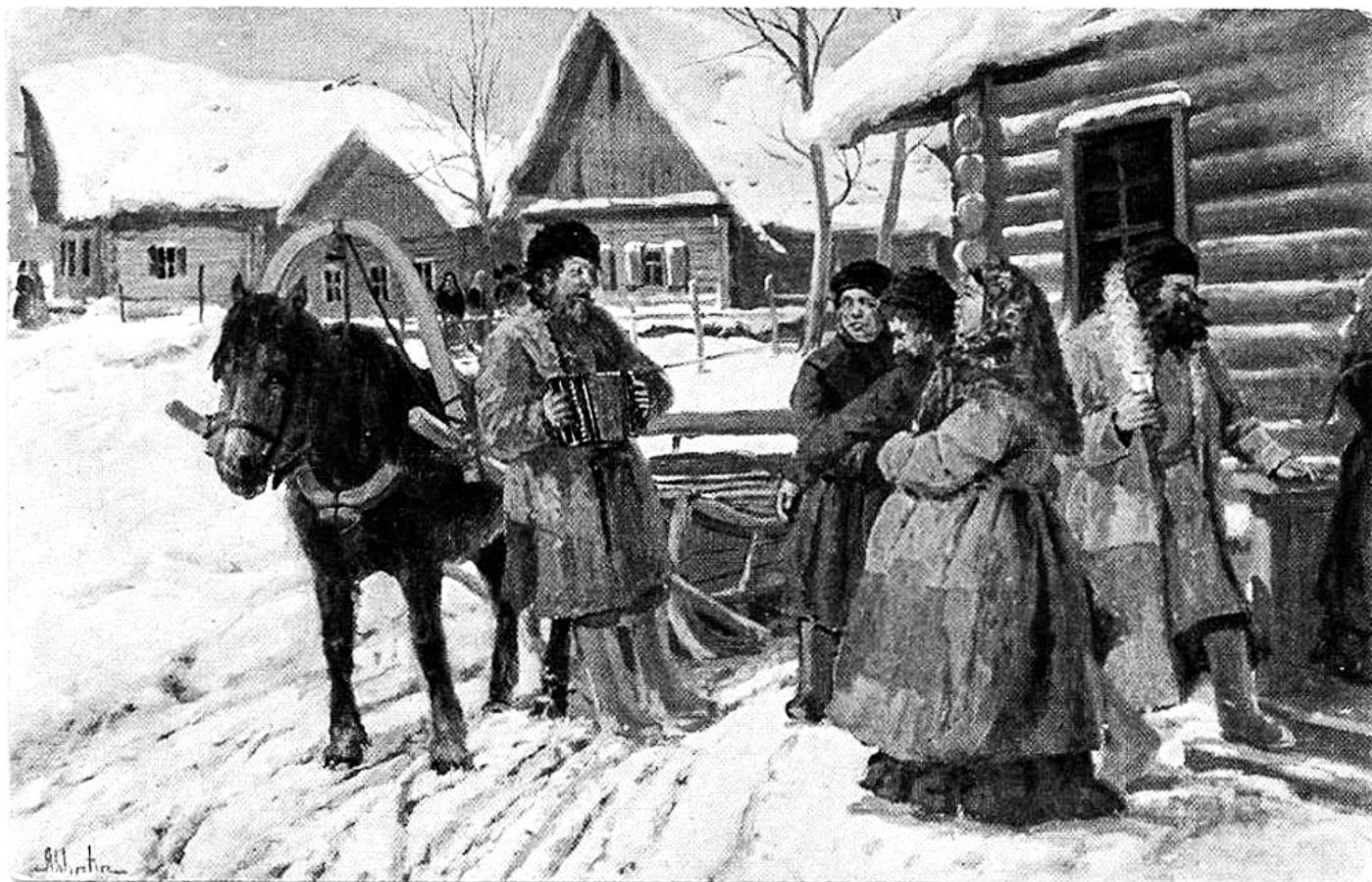
И.М. Львов. Праздничный день. Художественная серия Акционерного Общества Гранберг. Почтовая карточка. Начало XX в.

«ТОМСКАЯ ЕПАРХИЯ В 1902 ГОДУ. ...Что касается до нравственного состояния паствы, то в этом отношении нет заметного различия между старожилами и переселенцами, и состояние это нельзя считать удовлетворительным. Только одни из пороков и недостатков нравственной жизни более свойственны переселенцам, другие – старожилам. Такими общими