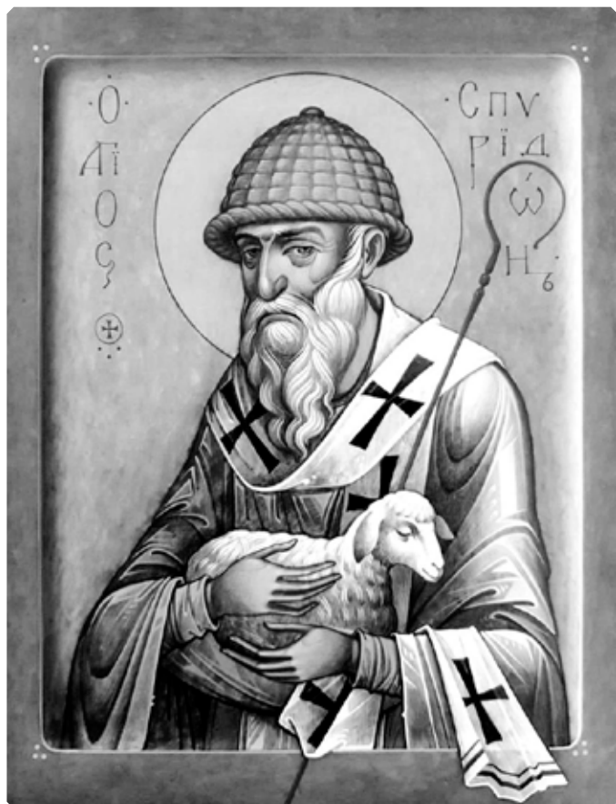
Святитель Спиридон, епископ Тримифунтский, чудотворец.

Делает Господь, делают и его святые. Они – соратники Божии, содействующие Ему в спасении людей. И один из выдающихся делателей на этой ниве – святитель Спиридон. Чудеса, происходящие по молитвам святого неисчислимы. Об одном из них однажды рассказал архимандрит